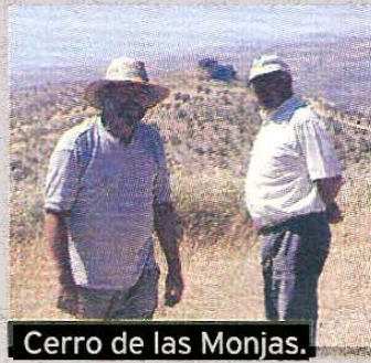
Cerro de las Monjas.