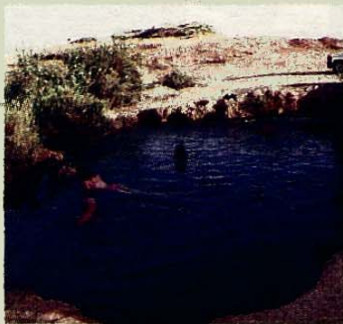
Pozas calientes de Santa Fe.